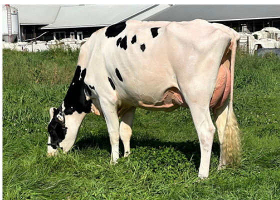
KINGSWAY LAMBDA AZELEA